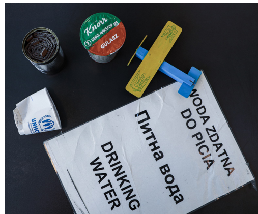
Fig. 4. Transitoriske genstande, som jeg har indsamlet for Immigrantmuseet. 1: en UNHCR-kop efterladt som skrald ved den polsk-ukrainske grænseovergang. 2: en blikdåse med pap som kan fungere som feltblus og varmekilde. Blikdåsen er lavet af frivillige nødhjælpsarbejdere ved den polsk-ukrainske grænse med det formål at blive sendt til fronten i Ukraine. 3: Knorr Gulasz uddelt af IOM til de nyankomne flygtninge på togstationen i Przemyśl. 4: Et fly i træ lavet af et ukrainsk barn i 'Hope' transitshelteret i Przemyśl. 5: "Drinking water"-skilt, der har siddet på en vandpost ved grænseovergangen Medyka.

rejser (Henrich 2011:80-1, Poehls 2011:346, O'Reilly & Parish 2015:11, Naguib 2015:78). Omend omdiskuteret er de blevet fremhævet som stereotypiske, romantiserede og steriliserede materialiseringer af menneskelig mobilitet (Danylak i Henrich 2011:71). Dette er særligt relevant med hensyn til tvungen migration, hvor mennesker ofte må forlade deres hjem med meget begrænset tid til – eller mulighed for – at planlægge, hvilke ejendele de bringer med sig. Ved at indsamle genstande efterladt langs ukrainernes flugtruter kan vi netop tilvejebringe materielle vidnesbyrd på de barske omstændigheder, voldsomme begivenheder og uventede vilkårligheder, som omgærdet flugt.