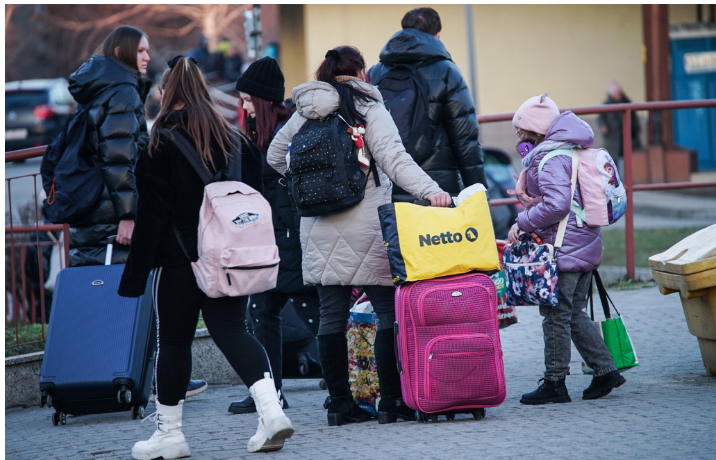
Fig. 3. Fordrevne ukrainere på vej tilbage til Ukraine. Przemysł banegård, marts 2023.

Amerikanske Jay, som udtalte disse ord, blev hurtigt en del af styregruppen bag det midlertidige flygtningecenter i det gamle Tesco-supermarked i Przemysł, der blev etableret som akut løsning på de overvældende mængder af flygtninge, som ankom til Polen i foråret 2022.