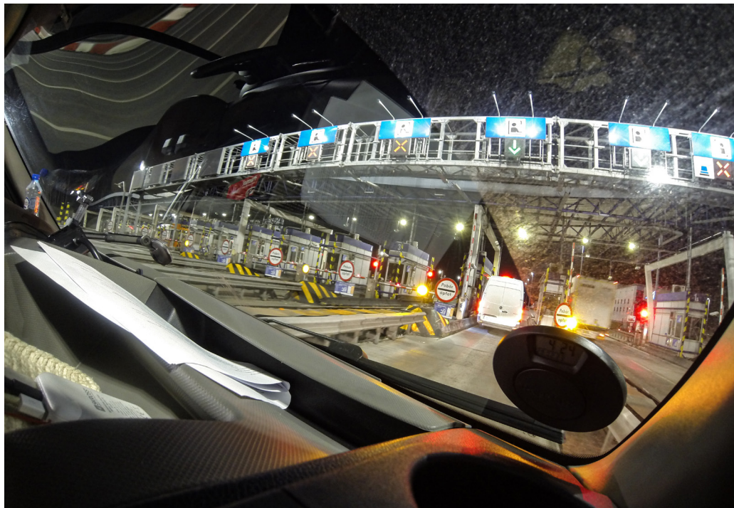
Fig. 7. GoPro-optagelse af turen fra Danmark til Ukraine, set fra forsædepassagerens perspektiv. Marts 2023.