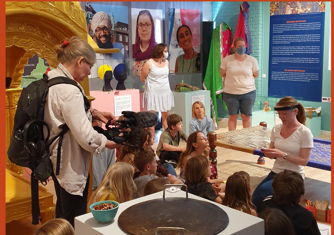
Det fælles projekt, "Din Udstilling", er udviklet af Københavns Professionshøjskole og Innovationsfonden.

“ FOKUS SKULLE IKKE VÆRE PÅ, HVAD ELEVERNE TROEDE MUSEET VILLE HAVE, MEN DERIMOD HVORDAN DE SELV GERNE VILLE LAV EN Udstilling