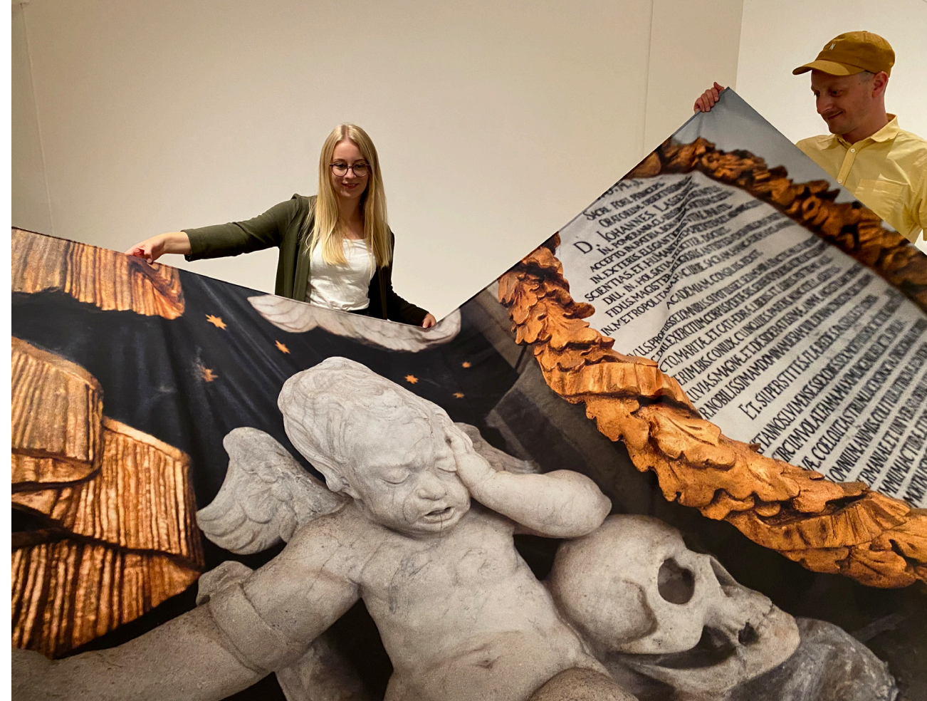
”Som tilskuere læser vi vores egen historie ind i billederne. Vi giver plads til følelser.”

Om det er lykkedes for teamet, må meget gerne komme an på en prøve. Udstillingen Død og begravet – enden på en rejse, kan ses på Immigrantmuseet i Farum Kulturhus til cirka 30. marts 2022.