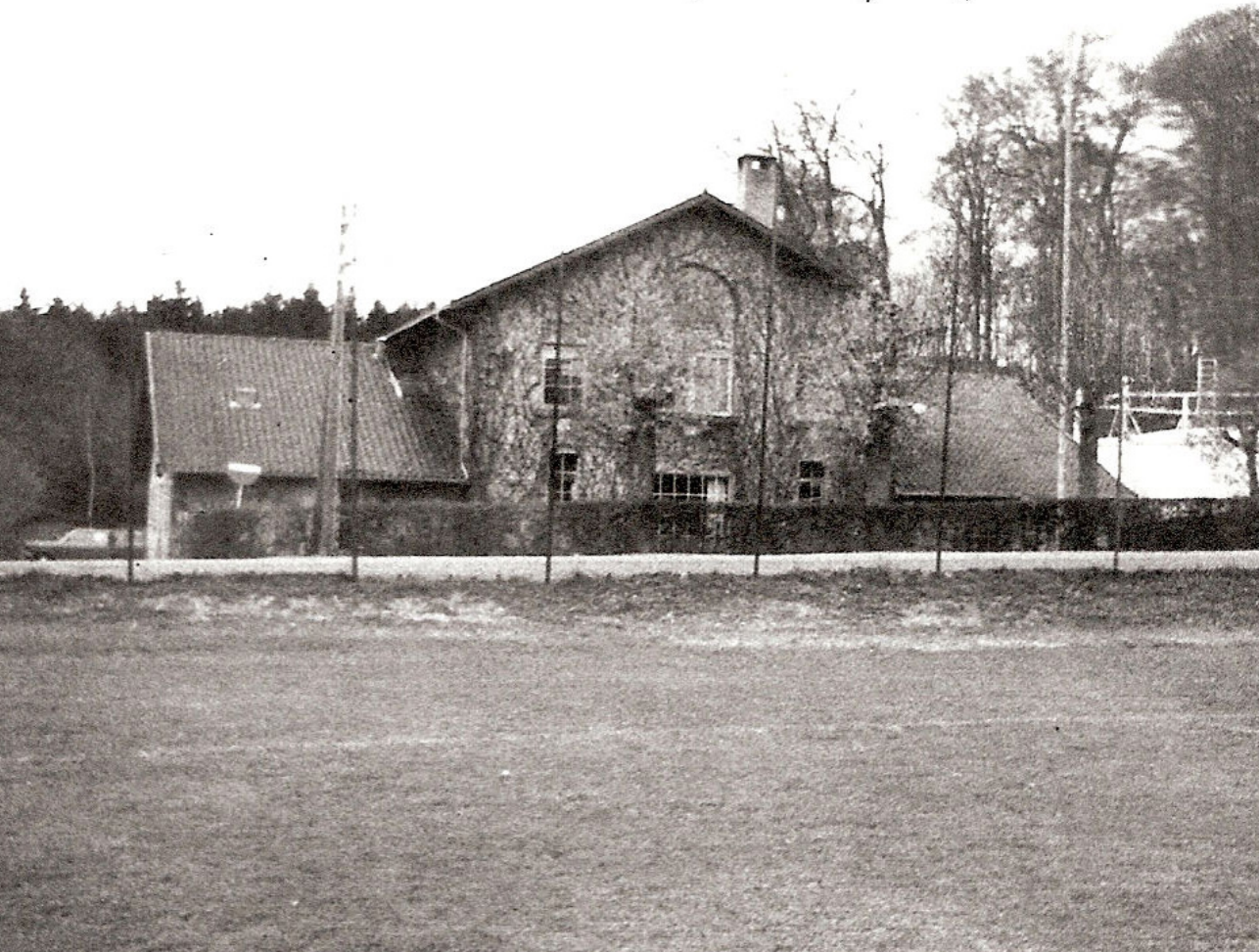
Hareskovby Gasværk blev bygget på en grund nedenfor Hareskovpavillonen, og blev taget i brug d. 13. september 1927. Efter driften af gasværket var ophørt, blev bygningen - vistnok i 1970 - indrettet til Fritidsklubben Gasværket.

Kommunerne drev selskabet videre indtil 01.01.1969, hvorefter selskabet blev overdraget til A/S Strandvejsgasværket.