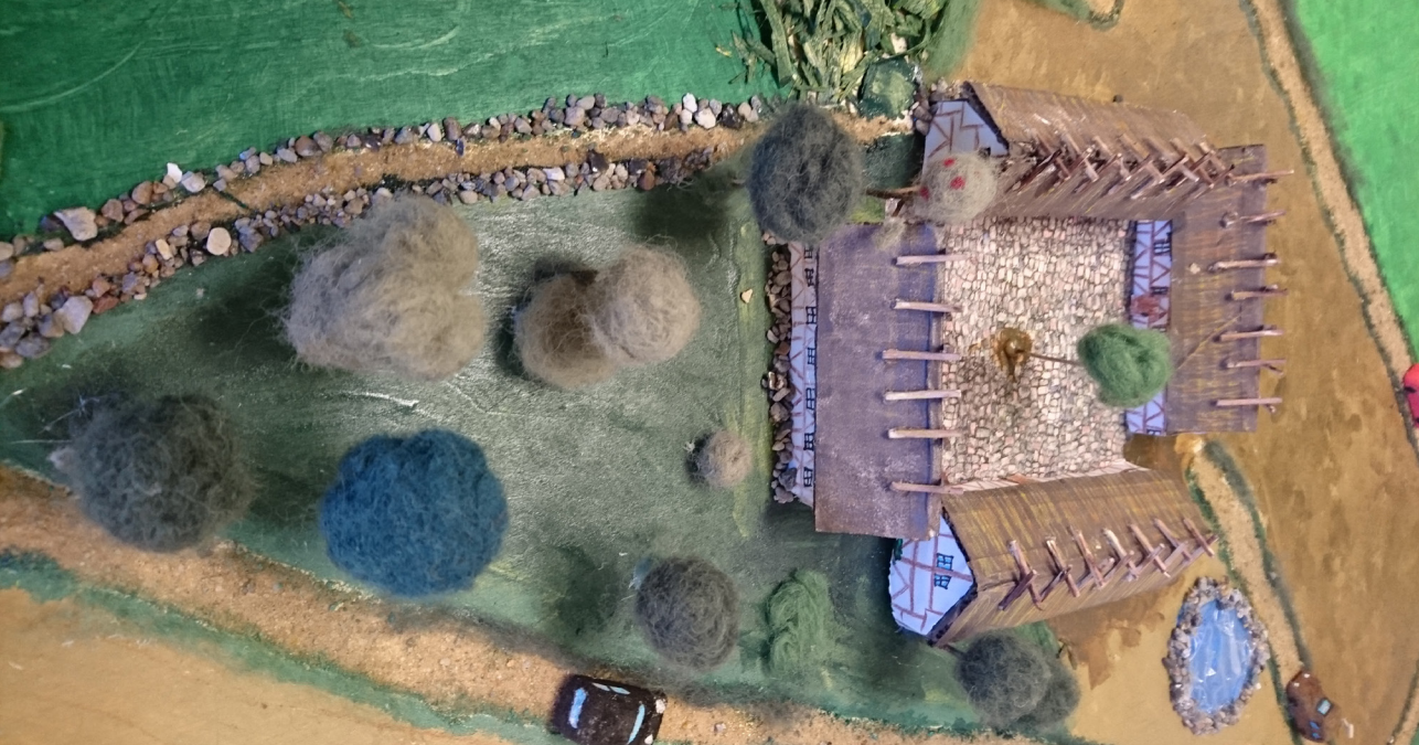
Udsnit af udstillingen