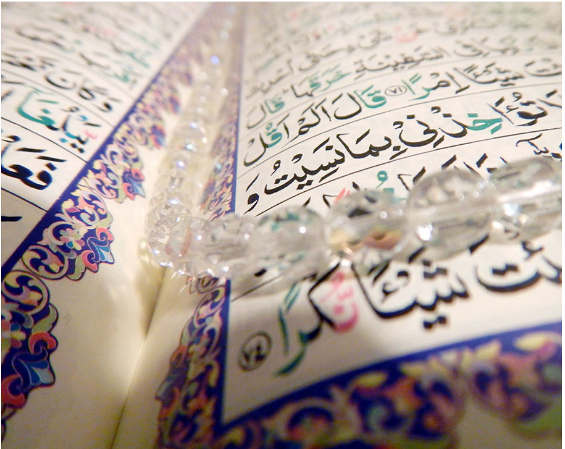
Fototekst: Fra udstillingen INDENFOR.

“ DE POETISKE OG KANTEDE FOTOGRAFIER GIVER SAMMEN MED DE UNGES EGNE EFTERTÆNKSOMME KOMMENTARER, ET INDBLIK I HVERDAGEN BLANDT NOGLE AF DE 200.000 HERBOENDE MUSLIMERE.