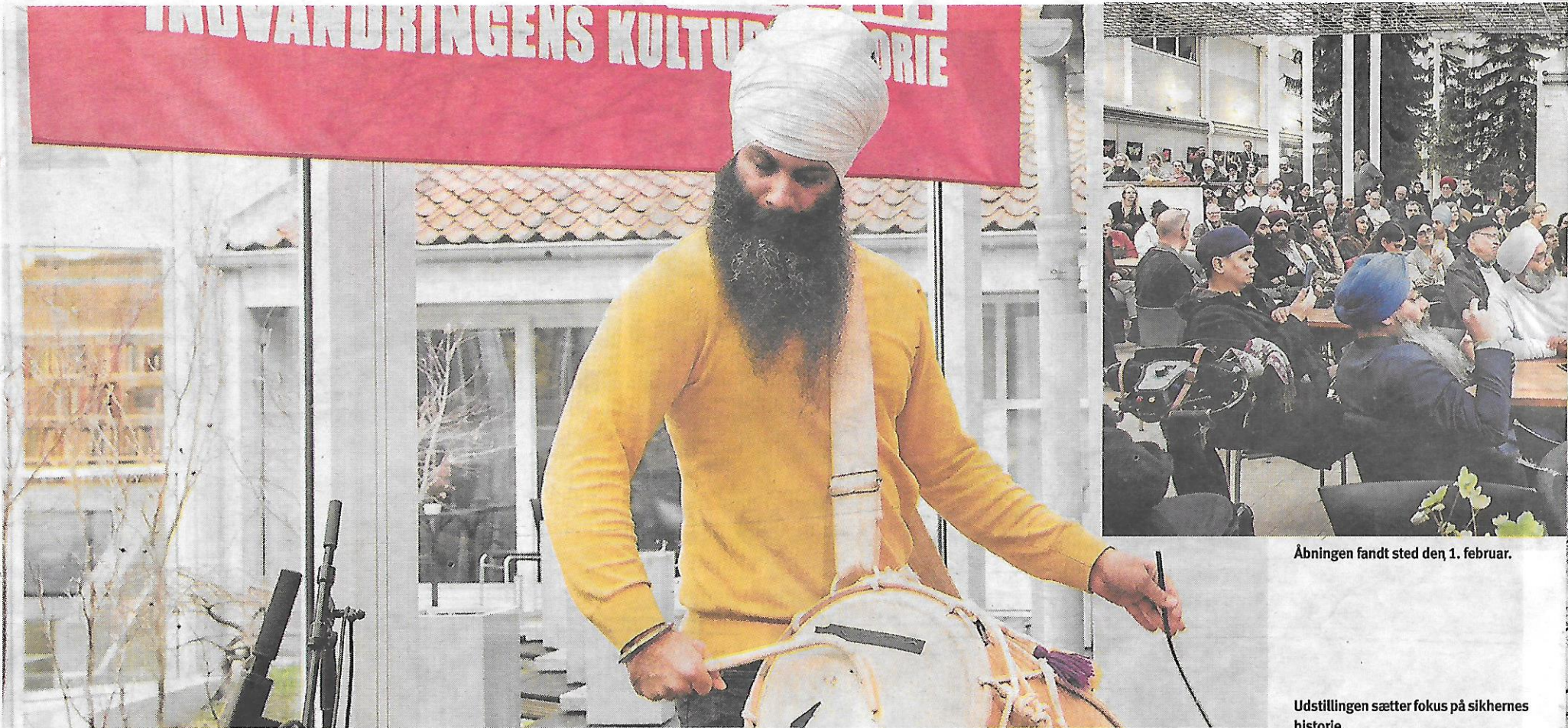
Åbningen fandt sted den 1. februar.