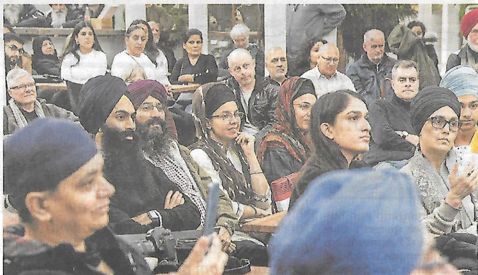
Åbningen af udstillingen trak en del til Farum Kulturhus.