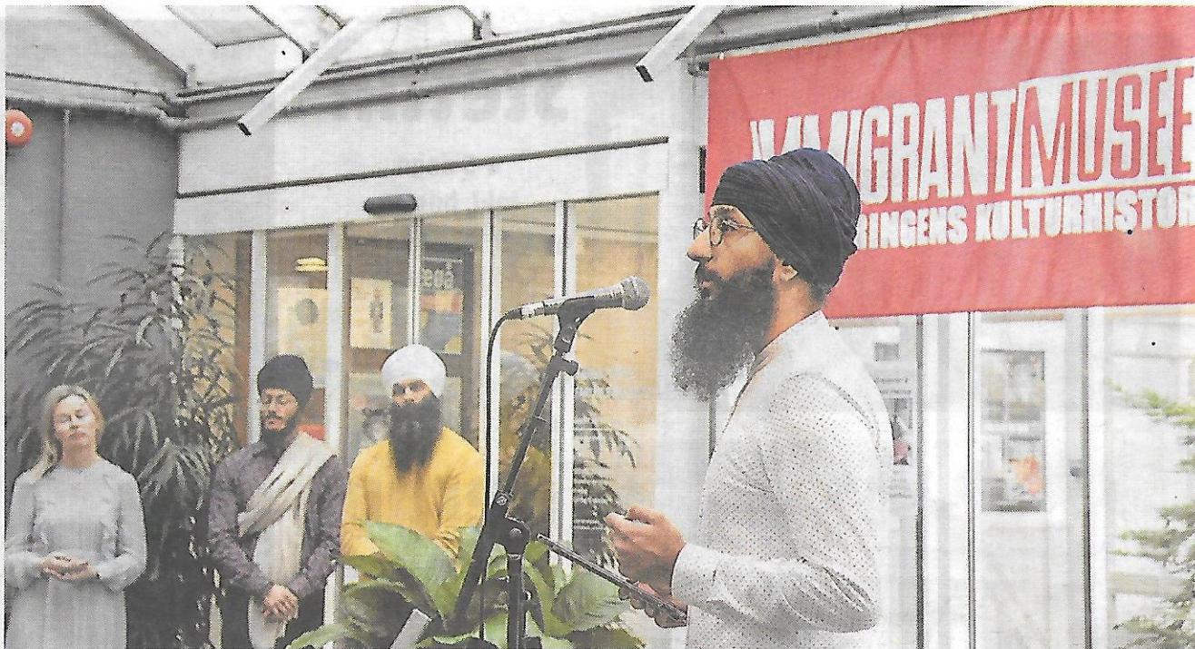
Den særlige påklædning og kultur kan opleves på Immigrantmuseet.