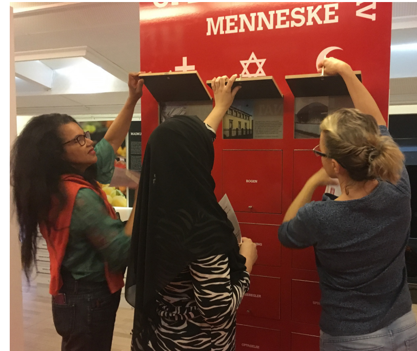
Første hold kursister fra Furesø Sprogskole afprøver de nye forløb på Immigrantmuseet.

Stemningen var høj, da holdet trådte ind af