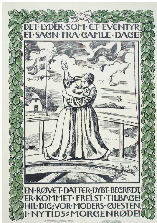
Dansk afstemningsplakat, Grænseforeningen.

Kongen og regeringens holdninger var altså uforenelige, og Christian 10. blev både fra folkelig såvel som fra politisk side opmuntret til at smide regeringen på porten.