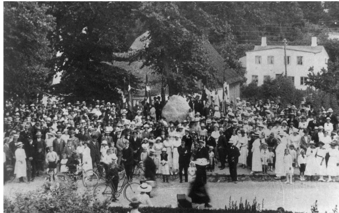
Genforeningen blev fejret i hele Danmark, også i Farum. Søndag den 17. juli 1920 deltog omkring 1.000 mennesker ved afsløringen af Sønderjyllandsstenen. Furesø Museer.

Parlamentarisk var der uenighed om, hvorvidt kongen havde beføjelserne til at afskedige regeringen. Regeringen havde nemlig et snævert flertal for deres grænsepolitik. Omvendt var parlamentarismen, trods systemskriftet i 1901, endnu ikke slået fast med syvtommersøm. Avisen Social-Demokraten var dog ikke i tvivl. Under den historiske overskrift "Kongen begaar Statskup" piskede avisen en stemning op. Samtidig truede fagbevægelsen med generalstrejke. Situationen var ude af kontrol, og kongen kom under tiltagende pres, særligt da