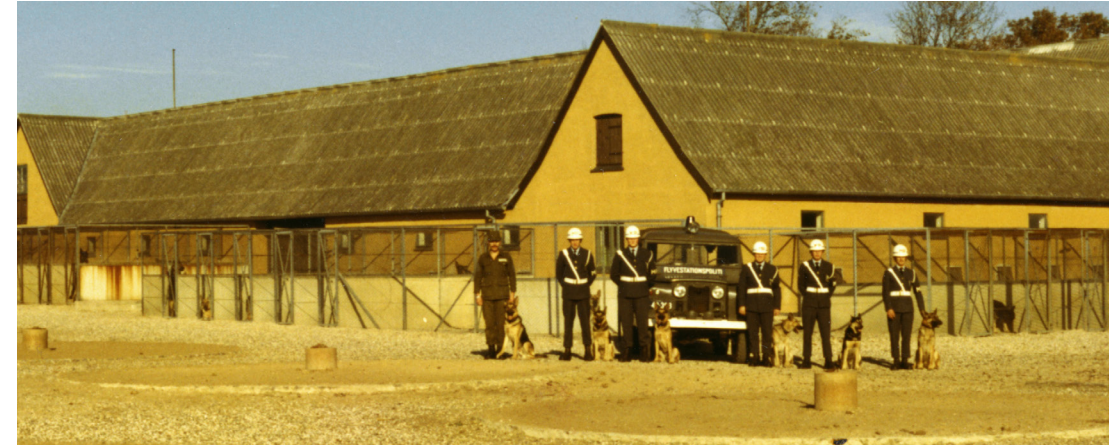
Flyvestationspolitiet opstillet udenfor Fuglebækgård i 1972. Udendørsburene til hundene ses langs husmurene.

I 1979 blev Hundeførerskolen flyttet til Flyvestation Karup, og Fuglebækgård blev i stedet base for flyvestationens håndtering af flybrændstof, herunder styring af tankbilerne, der skulle sørge for flyvemaskinernes optankning. Dermed var en vigtig æra forbi på flyvestationen. Tilbage på museet står hundehuset, der sammen med beretninger indsamlet fra tidligere medarbejdere på Flyvestationen, fortæller vores fælles kulturhistorie.