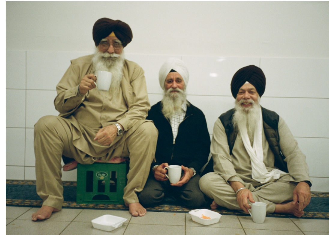
Et øjebliksbillede fra den ene af sikhernes to gurdwaraer, Sri Guru Singh Sabha Copenhagen, der ligger i Vanløse.

“ MED UNDER 2000 DANSKE MEDLEMMER ER SIKHERNE EN LILLE MINORITET I DANMARK, MENS SIKHISMEN ER VERDENS FEMTESTØRSTE RELIGION MED OMKRING 30 MILLIONER FØLGERE.