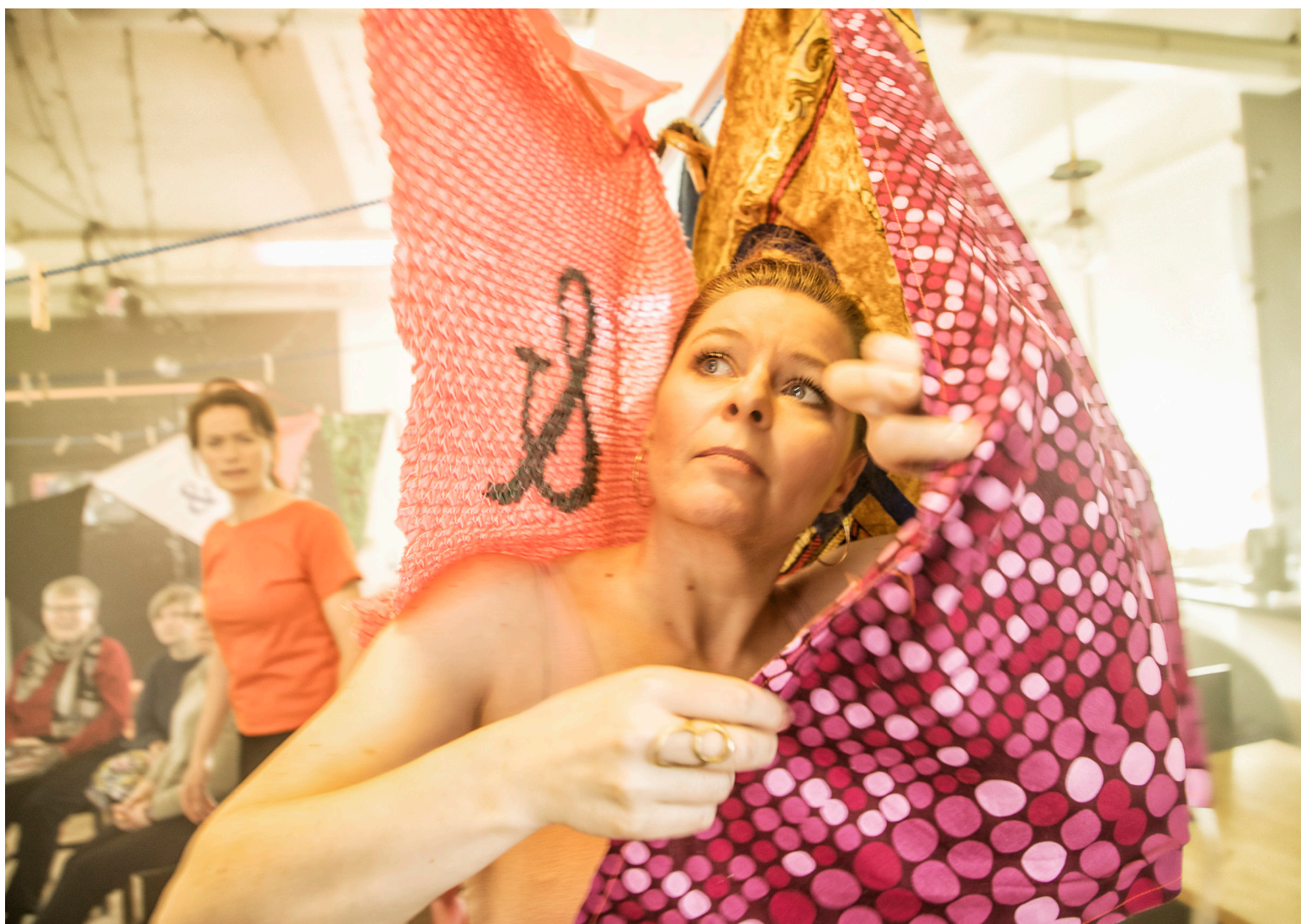
Fra teaterforestillingen "Ikke ude min mor" der spiller i Farum Kulturhus den 28. januar 2020.