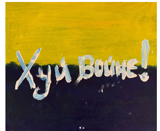
Inskriptionen "Fuck krigen" på et banner fra demonstrationen foran den russiske

Initiativerne hos Immigrantmuseet, Statens Museum for Kunst og Ukraine House er eksempler på, at samarbejdet med kulturarbejdere og forskere fra Ukraine er vigtigt. Foruden at sikre, at krigen er repræsenteret inden for museernes vægge, bidrager de også til en bedre forståelse af krigens skader på kulturarv såvel som et dybere indblik i den ødelæggelse som har ramt flere ukrainske byer. Kulturinstitutioner kan på den måde blive platforme for stemmer, der kalder på beskyttelse af kulturarven, mens krigen stadig foregår.