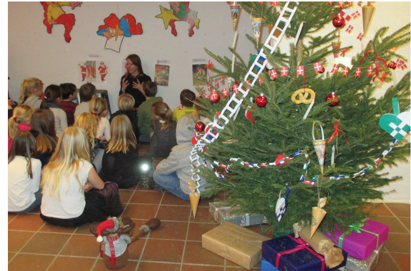
Nissejagt på Mosegaarden

Behandlede du nissen godt, så var din gård velsignet, men ve den, der mishandlede sin nisse. Så ville alverdens ulykke ramme gården. Værst stod det til, hvis nissen valgte at forlade gården. Så ville gården styrte i grus. Så nissen var et væsen, man skulle behandle med respekt.