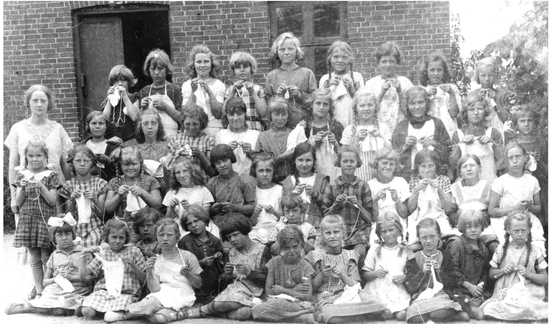
Fra 1899 blev der i skolerne undervist i håndarbejde for piger. På prøvekulde øvede eleverne sig i at sy, reparere og strikke, færdigheder der i høj grad var brug for. Her ses håndgørningsholdet på Lille Værløse skole 1926.

Tøj blev fortsat repareret, stoppet og lappet i stor stil. I museets udstilling kan man se en såkaldt opmaskningsmaskine til strømper, der blev brugt til langt op i 50'erne, også nylonstrømper blev masket op. Erindringer fra Værløse fortæller om,