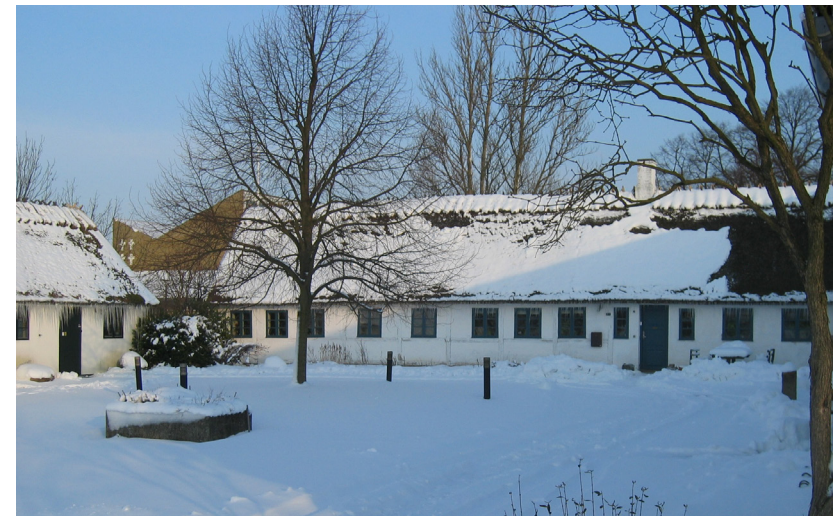
Mosegaarden i sne