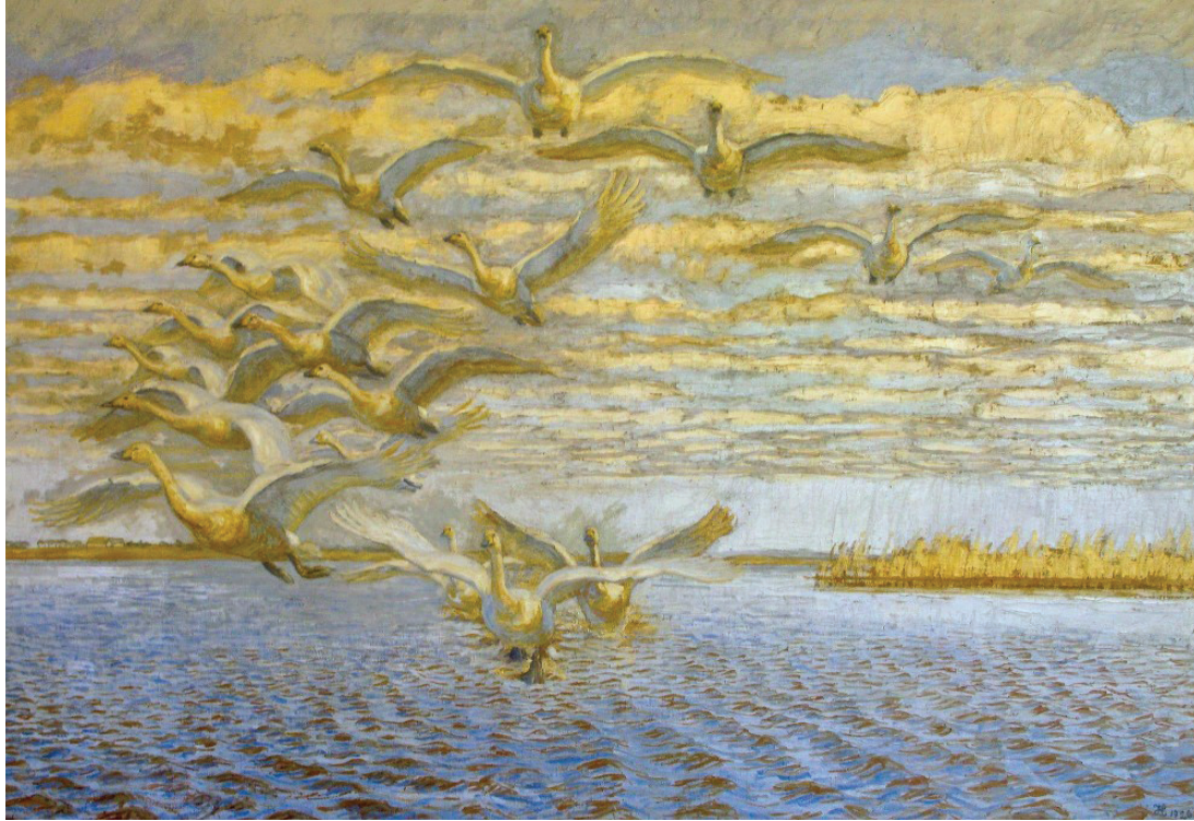
Johannes Larsen, Sangsvanerne letter, 1926. Johannes Larsen Museet.