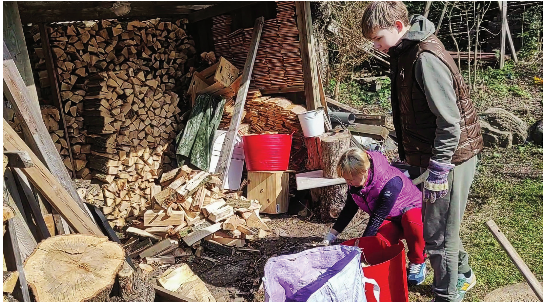
Ukrainere hjælper med at stable brænde i et værtshjem i Hareskovby. Marts 2022.

Udtrykket “at åbne sit hjem” indeholder en fore-