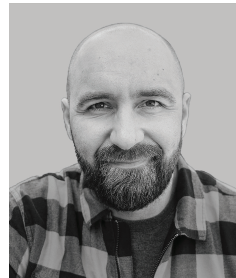
Artiklens forfatter, der netop er startet som videnskabelig assistent ved Immigrantmuseet