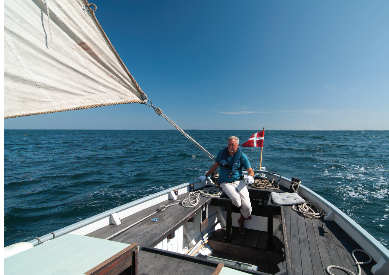
Forfatterens far ved roret ombord på Rylen.