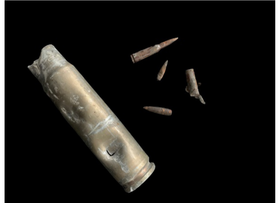
Kugler og rester fra patronhylster fundet af en dansk frivillig i Bucha – en by i Kyiv-regionen, der blev kendt for massedødet på hundrevis af indbyggere i de første uger af krigen.

Symposiet The Collective Body Dismembered. Histories of Art, Identities and the War , som fandt sted den 31. maj på Statens Museum for Kunst var den mest væsentlige begivenhed, som problematiserede krigens tilstedeværelse. Som en del af symposiet blev gulvet overladt til kulturarbejdere, antropologer, kunstkritikere og kunstnere. De diskuterede emner som kulturelt samarbejde mellem Danmark og USSR, værdien af det 20. århundredes monumentalkunst i begge lande, ødelæggelsen af modernistisk arkitektur efter invasionen samt udviklingen af samtids-