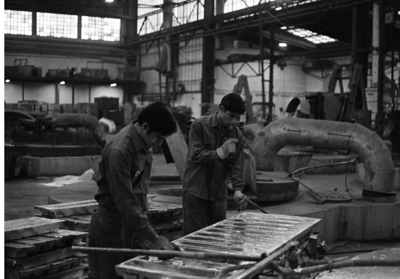
Gæstearbejdere i støberiindustrien i 1970'erne.

Hold øje med Immigrantmuseets hjemmeside og sociale medier for mere information.