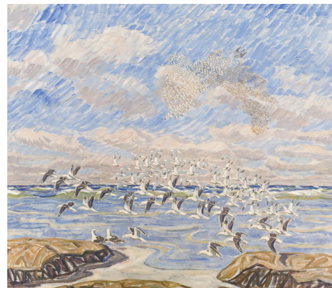
Knud Kyhn; Vandrefalken jager, 1945. Statens Museum for Kunst.